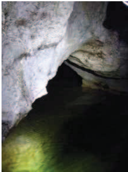
Abbildung : Der Bereich dahinter war die Querung und die nassen Füße wert!

Das Ziel der Expedition vom Januar war es unter anderem, die im Dezember neuentdeckten Bereiche und Schächte weiter zu verfolgen und zu vermessen.