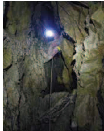
Abbildung : Im obersten Bereich der HDS. Und eine Kluft führt nochmal etwas weiter nach oben.

Das Wasser ist so klar und steht so still, dass man genau hinschauen muss, um zu bemerken, dass man nach nur einem weiteren Schritt in hüfthohem Wasser stehen würde. Die Kluft weitet sich an ihrem einen Ende etwas und das Wasser liegt hier teichartig unter einem Bogen, auf dessen anderer Seite ein Gang trocken weiterführt. Die Seilquerung unter dem Bogen hindurch gelingt fast trocken und ich befinde mich in einem wunderschönen Gang aus weißem Kalkstein. In einem Becken vor mir liegt das Wasser ruhig und grünlich schimmernd, von wo es im tiefen Schwarz eines unzugänglichen Tunnels verschwindet.